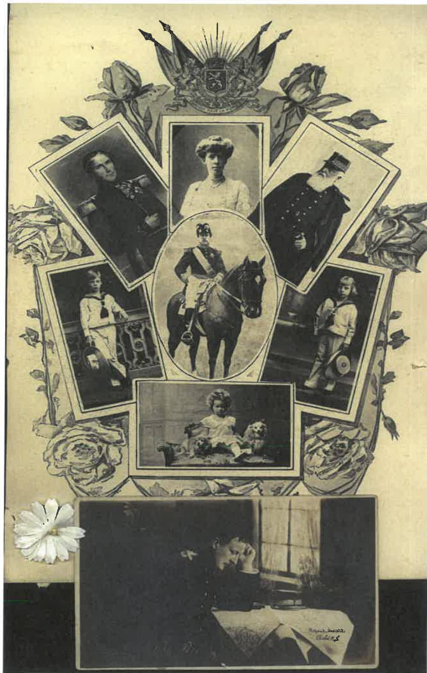
Deze kaart werd in de jaren '20 deur aan deur verkocht ten voordele van de oorlogsslachtoffers van de Grootte Oorlog

De geschiedenis van de klaproos, korenbloem en madeliefje lopen een beetje samen op.