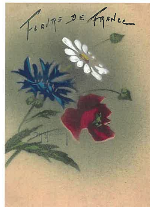
Handgemaakte postkaart 1915